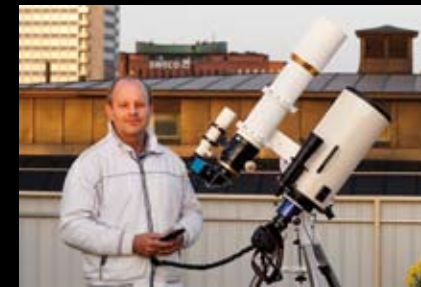
Författaren och hans teleskop på takterrassen i centrala Stockholm.