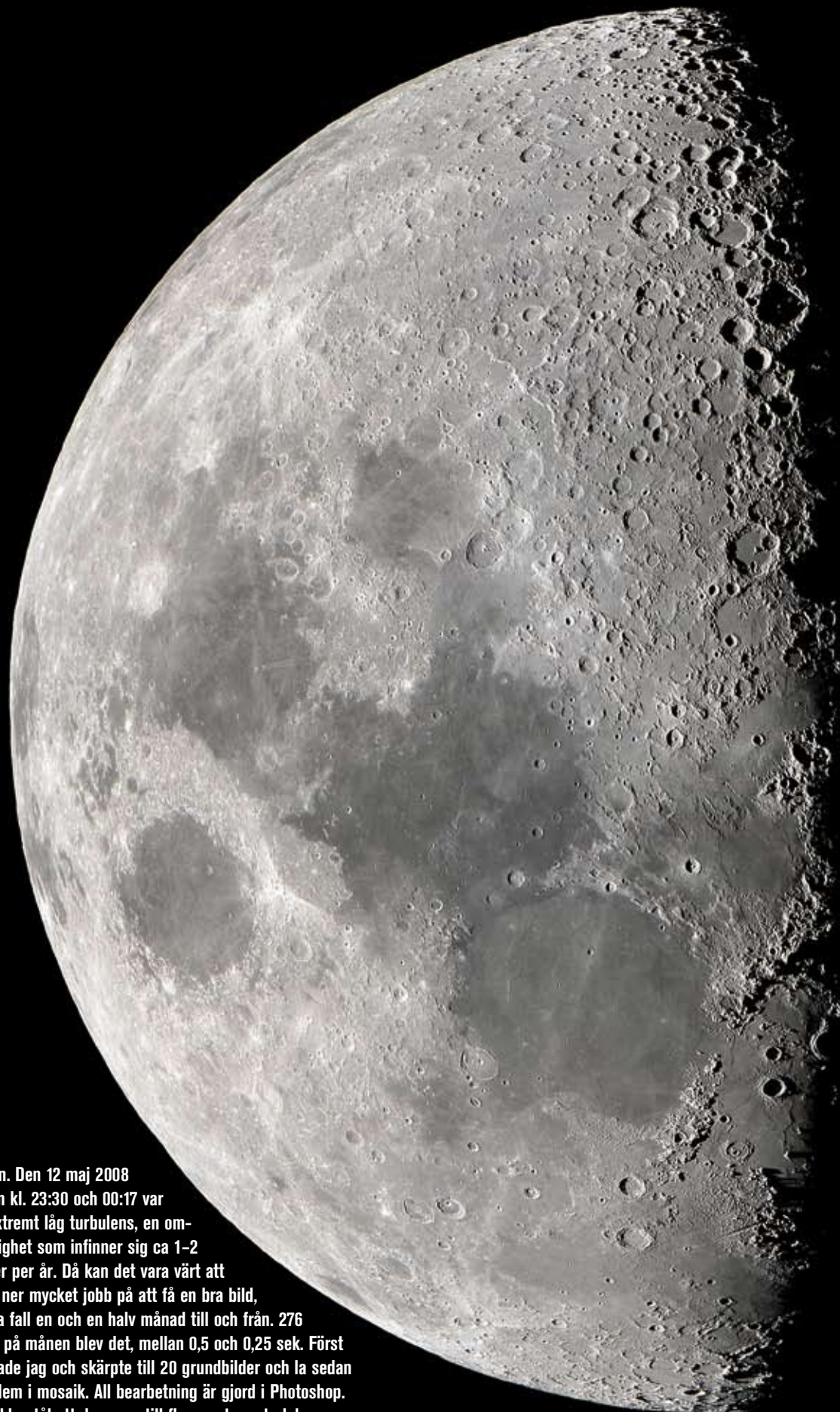
Månen. Den 12 maj 2008 mellan kl. 23:30 och 00:17 var det extremt låg turbulens, en omständighet som infinner sig ca 1-2 gånger per år. Då kan det vara värt att lägga ner mycket jobb på att få en bra bild, i detta fall en och en halv månad till och från. 276 bilder på månen blev det, mellan 0,5 och 0,25 sek. Först stackade jag och skärpte till 20 grundbilder och la sedan ihop dem i mosaik. All bearbetning är gjord i Photoshop. Slutbilden tål att dras upp till flera meters storlek.