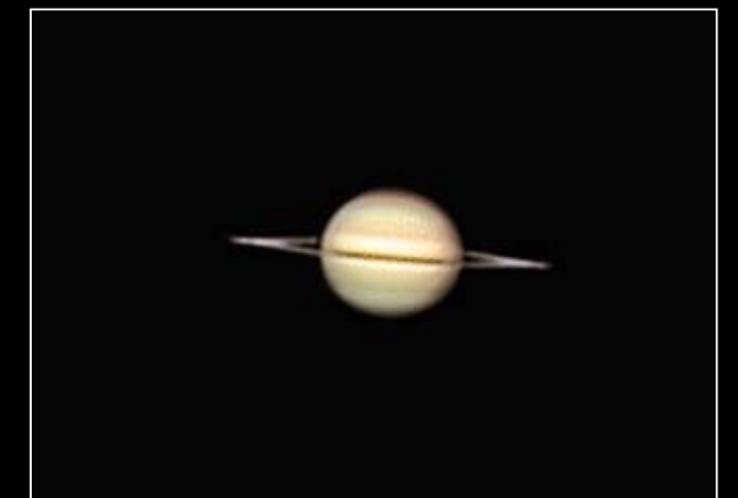
Saturnus den 18 mars 2009 med en DMK-41AF02 Astrokamera och LRGB filter. Över 5000 bilder har stackats till den färdiga färgbilden med hjälp av programmet Astro IIDC. Teleskop: Intes M 703.