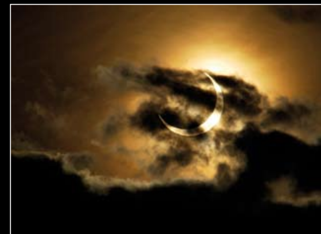
Solförmörkelsen i Stockholm den 31 maj 2003, fotograferad med teleobjektiv och utan filter när molnen låg framför solen. Man bör vara väldigt försiktig när man fotar solen.

Från och med maj till september gör många ett avbrott