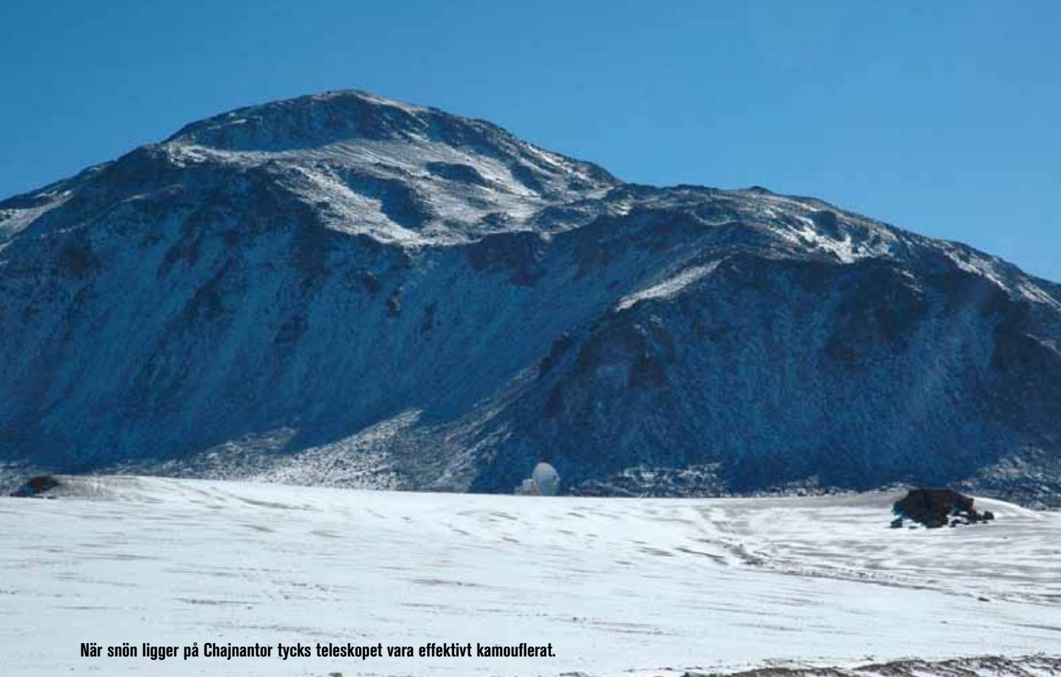
När snön ligger på Chajnantor tycks teleskopet vara effektivt kamouflerat.