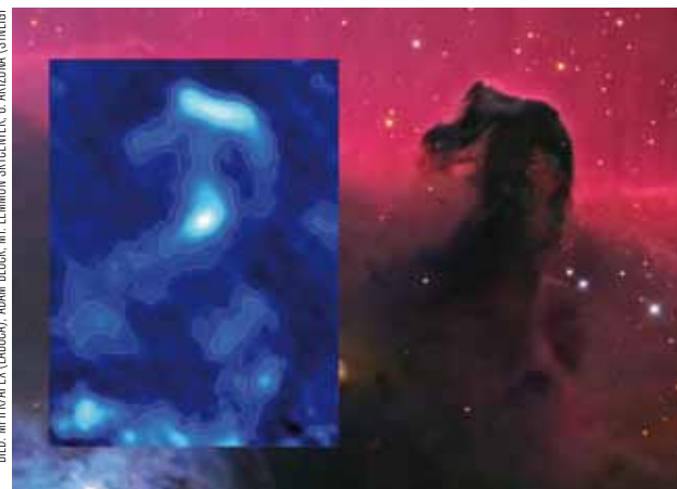
Hästhuvudnebulosan i Orion har som andra områden med stjärnor i vardande också avbildats med APEX kamera LABOCA. Den mörka stoftnebulosan lyser på sina ställen kraftigt i de våglängder APEX studerar.