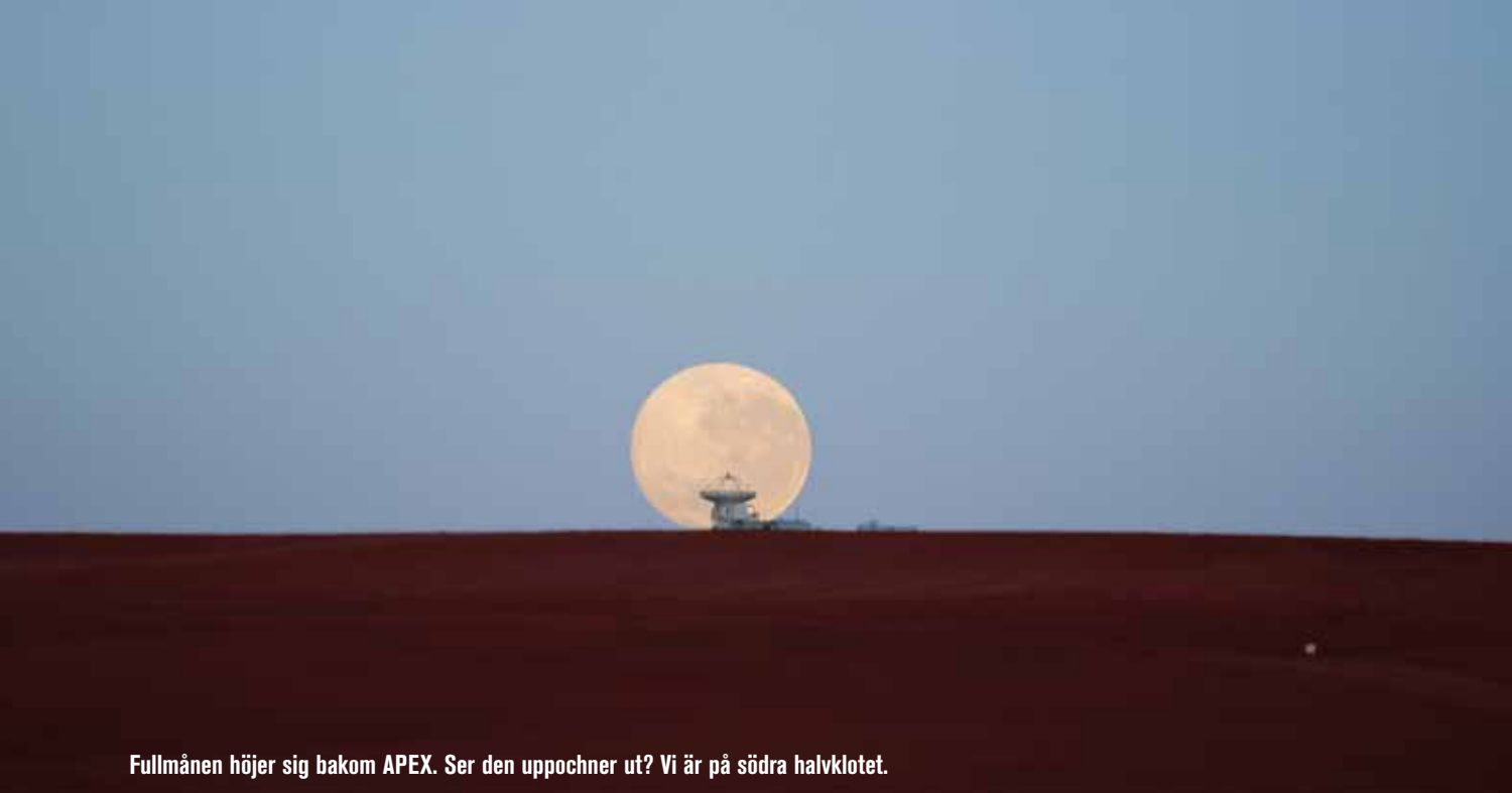
Fullmånen höjer sig bakom APEX. Ser den uppochner ut? Vi är på södra halvklotet.

terstrålning på grund av rödförskjutning. Dessa i sig själva mycket ljusstarka och avlägsna objekt kan till exempel vara unga och mycket aktiva stjärnbildande galaxer eller så kallade gammablixtar som kan uppkomma när tunga stjärnor kollapsar eller när två mycket kompakta objekt (neutronstjärnor eller svarta hål) kolliderar.