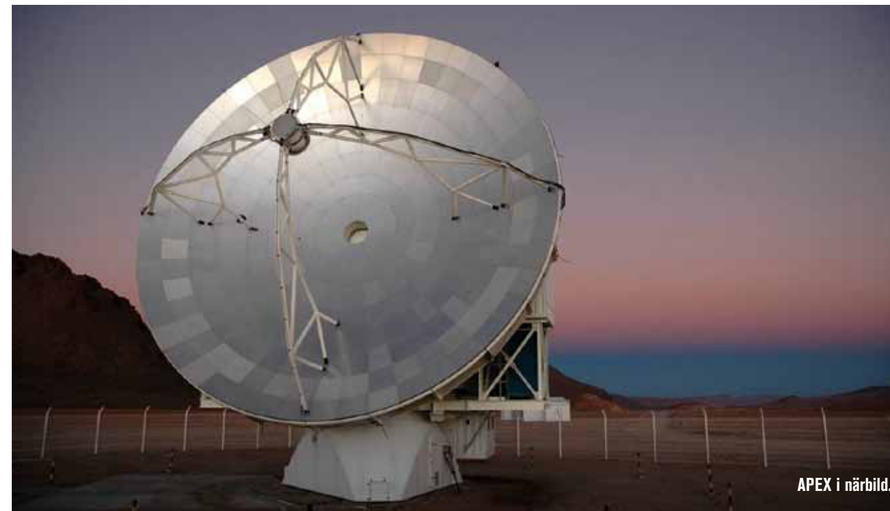
APEX i närbild.