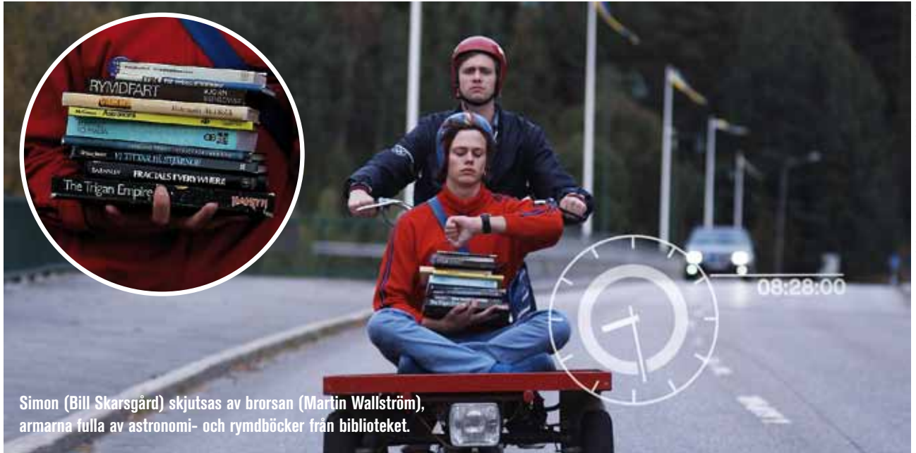
Simon (Bill Skarsgård) skjutsas av brorsan (Martin Wallström), armarna fulla av astronomi- och rymdböcker från biblioteket.