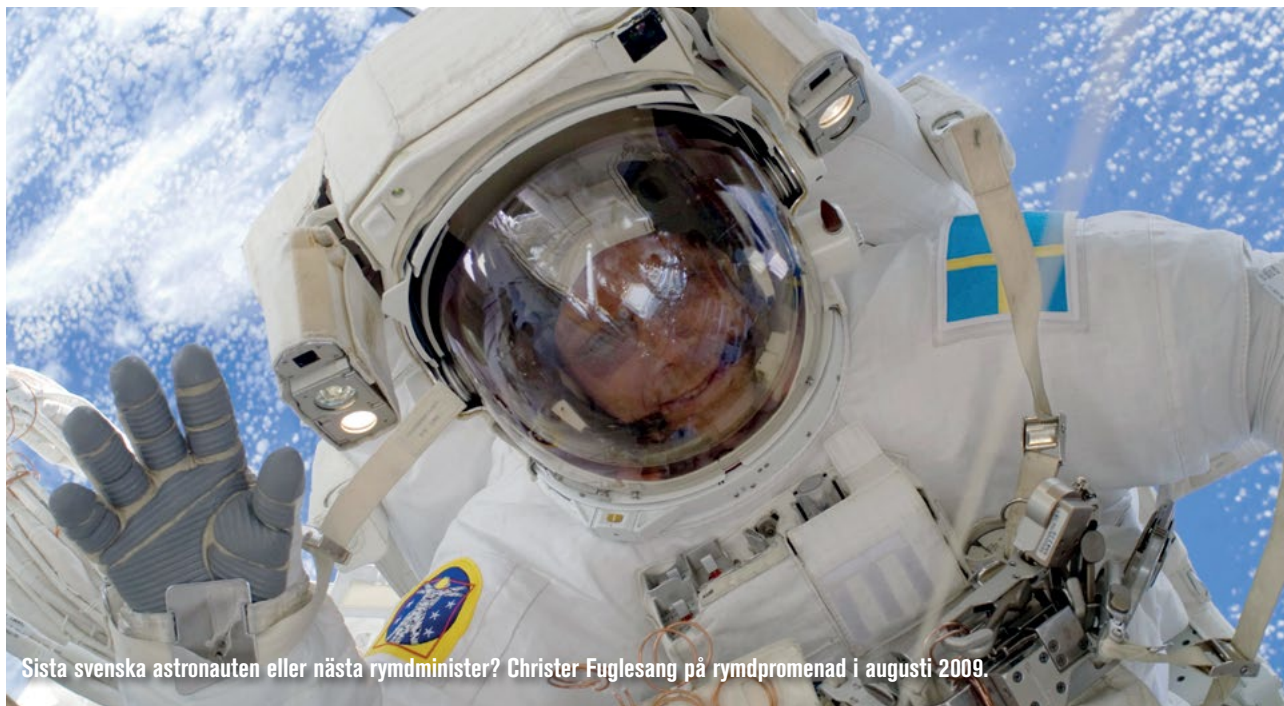
Sista svenska astronauten eller nästa rymdminister? Christer Fuglesang på rymdpromenad i augusti 2009

till planerna och därför är det av stor vikt att fråga hur viktigt det är det för partierna att Esrange byggs ut. De intervjuade är positiva, men pekar ut olika saker som först och främst behöver redas ut.