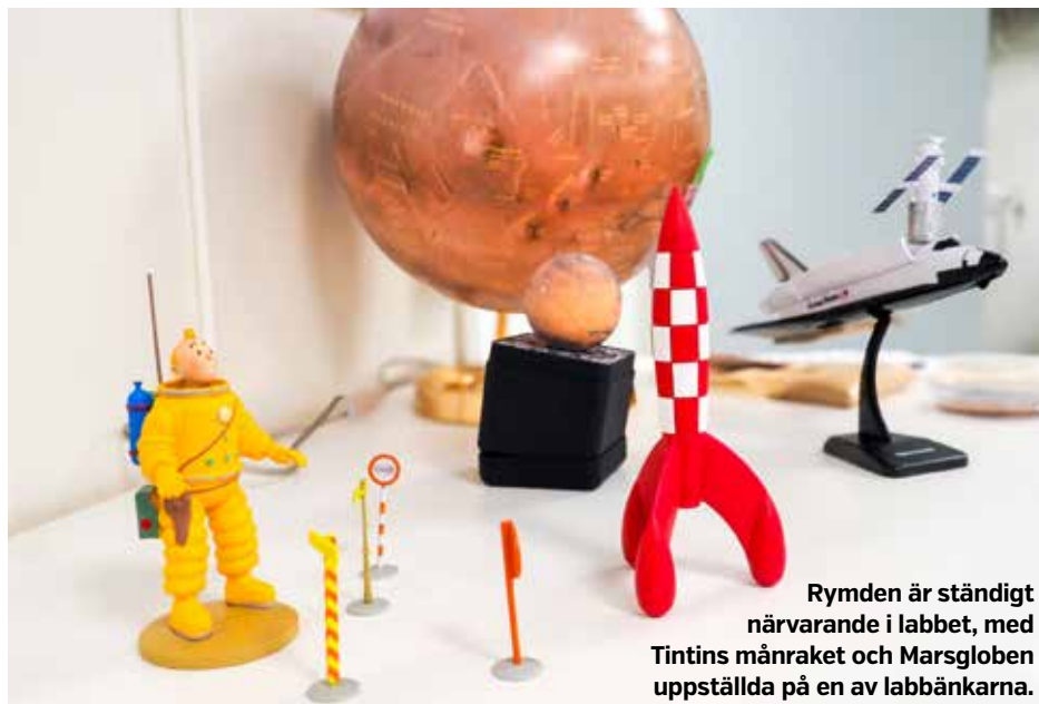
Rymden är ständigt närvarande i labbet, med Tintins månrocket och Marsgloben uppställda på en av labbänkarna.

Vi har fram tills nu varit själva i labbet, där ventilationen och spektrometern hummar, när hennes studenter och kollegor öppnar den tunga grå dörren. Hennes forskning bedrivs vid Kemiskt-Biologiskt Centrum, KBC, ett centrum vid Umeå universitet där över tusen forskare kan samarbeta över institutionsgränserna. Att det är just vid KBC som hennes labb befin-